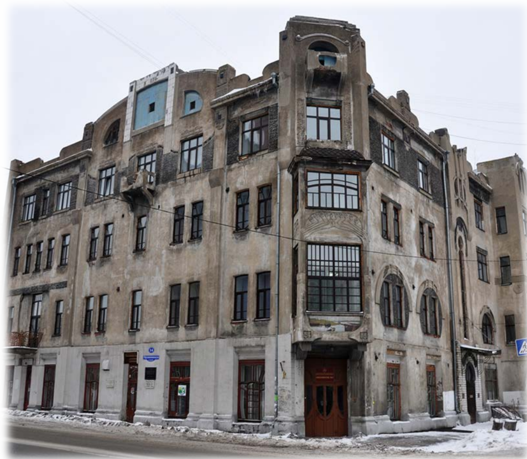
Ул. Орджоникидзе, 14

27 июля 1941 года институт перебазировался на новое место. Это создало не малые трудности, т.к. новое здание было построено для жилых нужд. Уменьшилось количество аудиторий, требовалось как "минимум 19, а было 15, и те оказались очень маленькие.